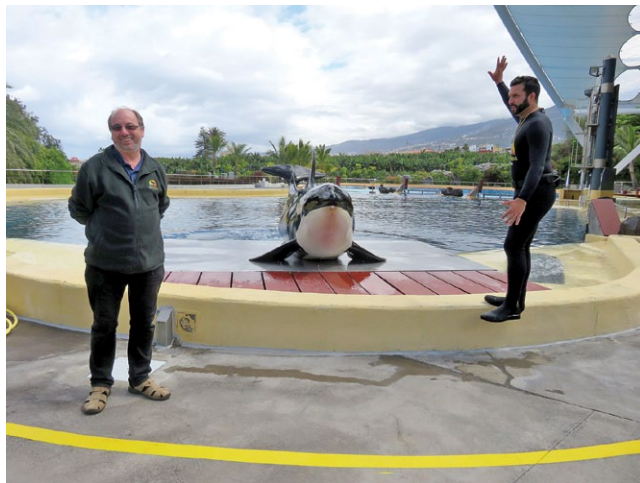
↑ Morgan, die vor der Küste der Niederlande fast verhungert gefunden und gerettet wurde, soll nach Meinung der Tierschutz-Extremisten ausgewildert werden. Für die schwerhörige Waldame wäre das ein sicheres Todesurteil.

Ganz klar, ich bin beides und Letzteres schon seit meiner Kindheit. Als Junge liebte ich Reportagen von Bernhard Grzimek (1909 bis 1987), die regelmäßig im Hessischen Rundfunk gesendet wurden. Grzimek war Tierarzt, Verhaltensforscher, Tierfilmer, Tierbuchautor, Direktor des Frankfurter Zoos und überzeugter Tierschützer. Als Elfjähriger schrieb ich ihm einen Brief und fragte ihn, was ich tun muss, um so zu werden, wie er? Zoologe war damals mein Traumberuf. Grzimek antwortete und schlug mir vor, im Tierpark Fauna in meiner Heimatstadt Solingen, ein Praktikum zu machen, um in das Arbeiten mit Tieren hineinzuschnuppern. Das tat ich und von diesem Moment an hat mich diese Leidenschaft nicht mehr losgelassen. Ich studierte in Düsseldorf und Bonn Biologie und habe dann