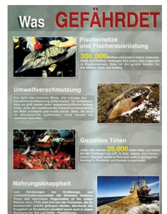
↑ Auf Plakaten werden die Gefahren für frei lebende Meeresbewohner erklärt.